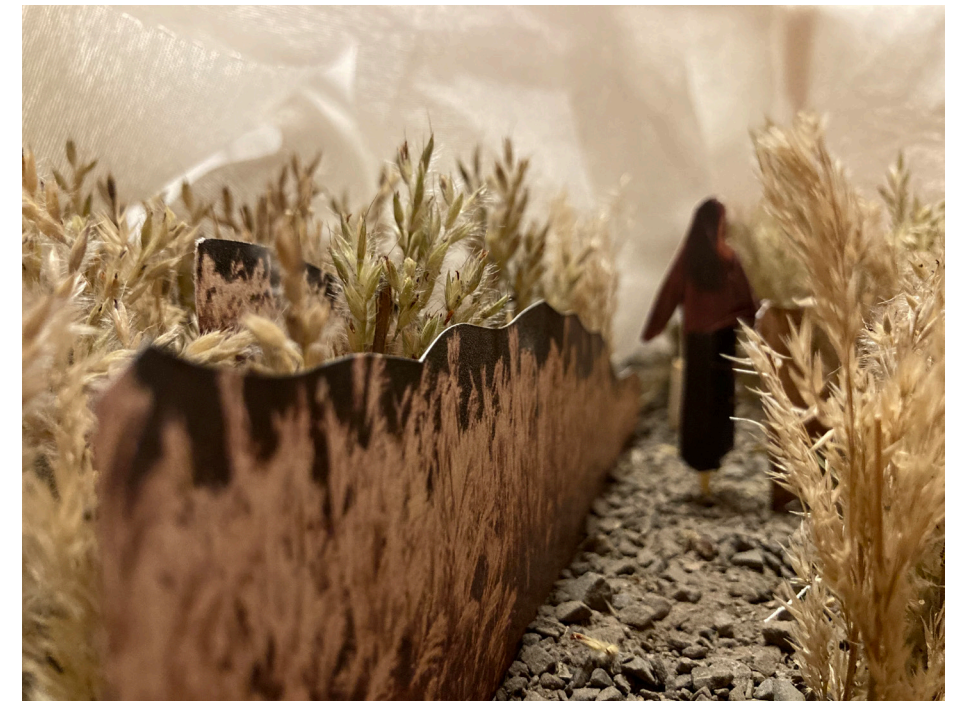
Ambiance intérieure, section champêtre