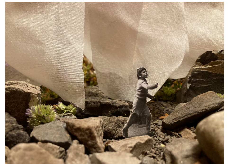
Ambiance intérieure, section rocheuse