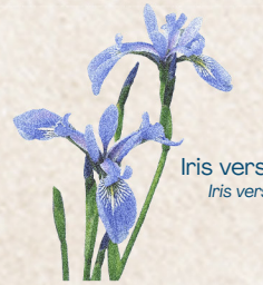
Iris versicolore Iris versicolor