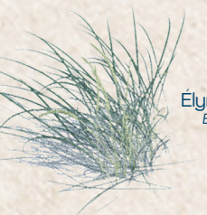
Élyme des sables Elymus arenarius