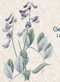
Gesse maritime Lathyrus japonicus