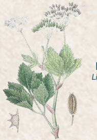
Persil de mer Ligusticum scoticum