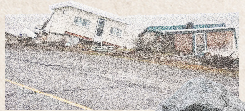
Maisons emportées par la marée à Ste-Luce

Les trois balançoires de l'installation, lorsqu'en usage, soulèvent et font danser les pierres en suspension, découvrant les dessous végétalisés, exposant la richesse de l'estran naturel. Au travers des rochers restants, les plantes du littoral s'affairent à maintenir la stabilité du sol, un rappel de l'ordre naturel des choses.