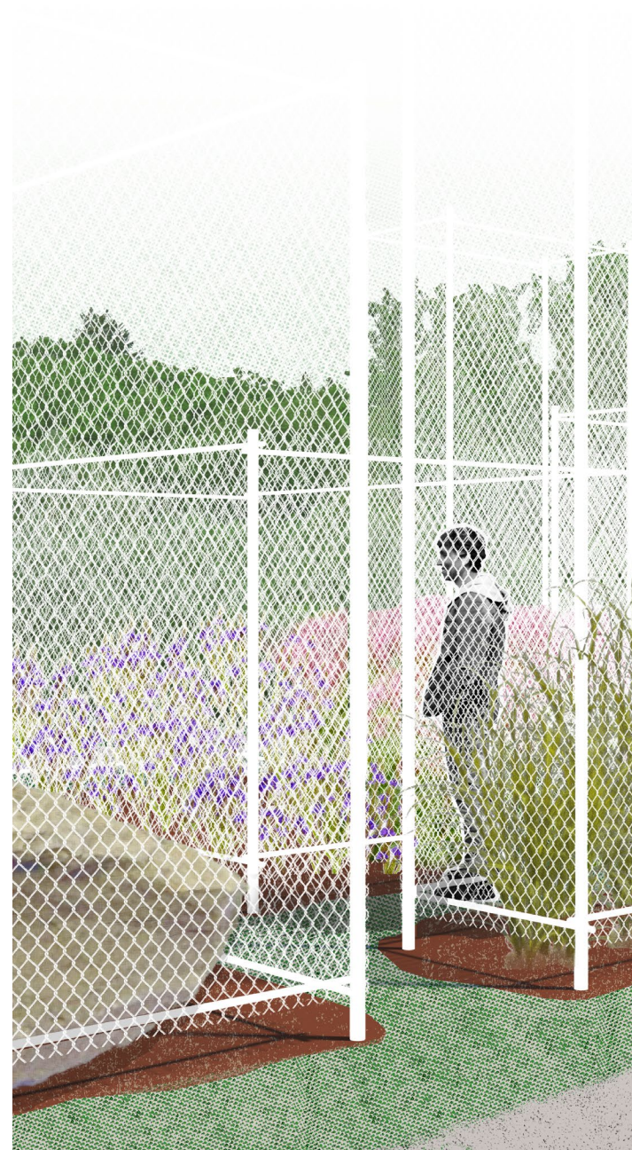
Vue en perspective 01