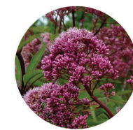
Eutrochium maculatum var. maculatum