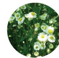
Erigeron philadelphicus var. philadelphicus