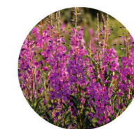
Chamerion angustifolium subsp.