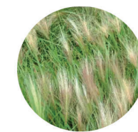
Hordeum jubatum subsp. Jubatum