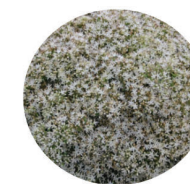
Sedum "bundle of joy"