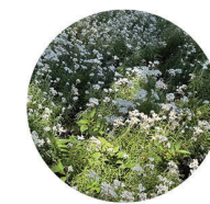
Anaphalis margaritacea Pearly Everlasting