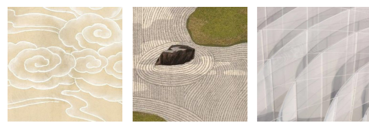
Références / matérialité