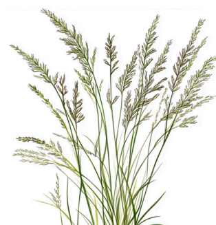
Deschampsia caespitosa 'Pixie Fountain'

Graminée ornementale de type compacte, atteignant environ 30 à 45 cm. Elle présente un feuillage dense et arché en forme de fontaine, avec des fleurs délicates qui émergent en été. Idéale pour les bordures ou les jardins de rocaille, elle ajoute une touche de légèreté et de mouvement.