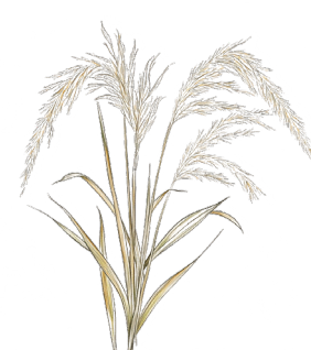
Miscanthus sinensis 'Malepartus'

Graminée ornementale à feuillage fin et des hampes florales légères, atteignant 1,0 à 1,5 mètre. Elle fleurit à la fin de l'été et est appréciée pour sa texture et son mouvement dans le jardin. Rustique et adaptable, elle convient aux jardins naturels.