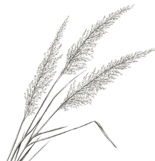
Calamagrostis acutiflora 'Brachytricha'

Graminée ornementale de type compacte, atteignant environ 30 à 45 cm. Elle présente un feuillage dense et arché en forme de fontaine, avec des fleurs délicates qui émergent en été. Idéale pour les bordures ou les jardins de rocaille, elle ajoute une touche de légèreté et de mouvement.