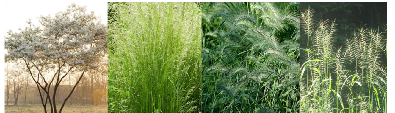
Amelanchier canadensis Deschampsia cespitosa Elymus canadensis Hystrix patula