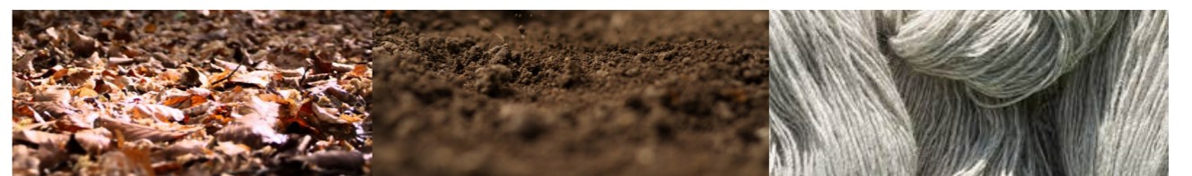
Feuilles Matière organiques décomposées Fibres végétales en chanvre