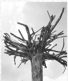
.... renversé, nettoyé, stabilisé.