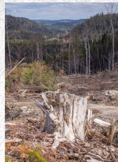
Arbres morts des forêts environnantes, victimes de la tordeuse des bourgeons de l'épinette. (Ou autre disponible) ....