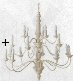
objets du quotidien